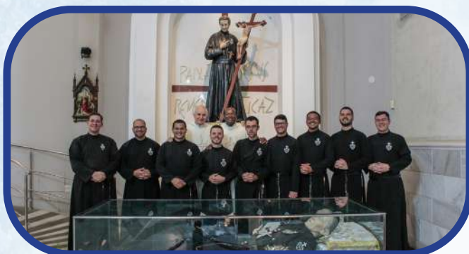
Teologado São Gabriel de Nossa Senhora das Dores (Belo Horizozonte/MG)