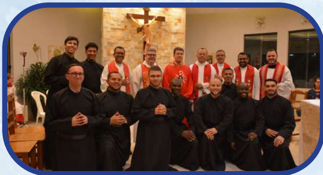
Noviciado Interprovincial Cristo Libertador (São Luis de Montes Belos /GO)