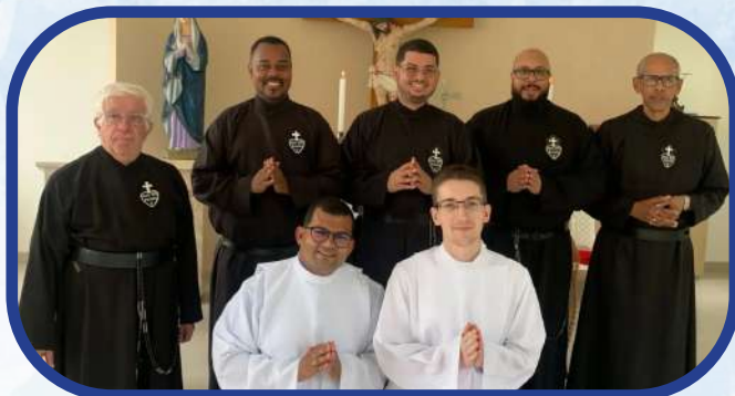
Aspirantado Jesus Crucificado (Jequié-BA)

Desejamos aos nossos formandos a perseverança, que São Paulo da Cruz e São Gabriel de Nossa Senhora das Dores os acompanhem em sua missão e sua vida vocacional. E aos formadores e todas as comunidades formativas o agradecimento e orações de toda província.