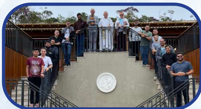
Postulantado Nossa Senhora da Vitória (Cariacica/ES)